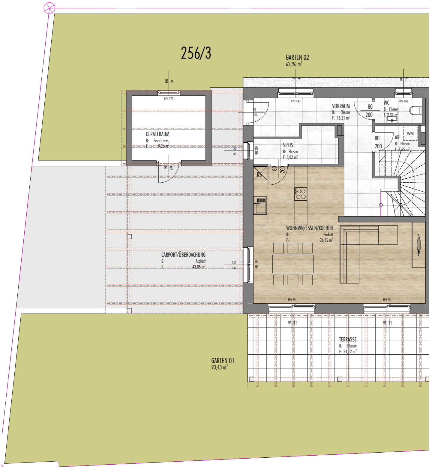
0. EG VKP 1:100