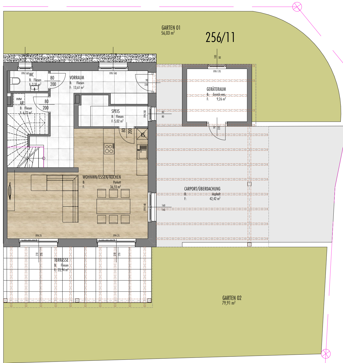
0. EG VKP