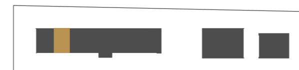
HAUS A B C